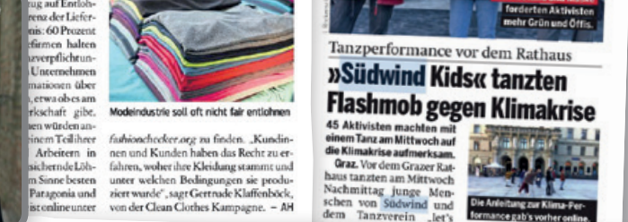
Modeindustrie soll oft nicht fair entlohnen

CLEAN CLOTHES. Am Donnerstag fand der Welttag für menschenwürdige Arbeit statt. Zu diesem Anlass hat die Clean Clothes Kampagne die Modebranche in der Kritik. Nur fünf Modefirmen geben an existenzsichernde Löhne zu zahlen.