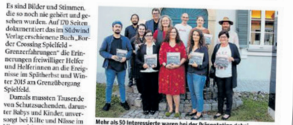
Mehr als 50 Interessierte waren bei der Präsentation dabei

Zur Lesung des Buches „Border Crossing Spielfeld - Grenzerfahrungen“ wurde geladen.