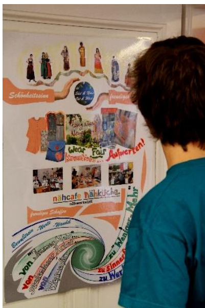
Kleidertauschparty im Rahmen eines Südwind-Jugendprojektes, Textil-Ausstellung der AktivistInnen wurde gezeigt und von AktivistInnen betreut, April 2014