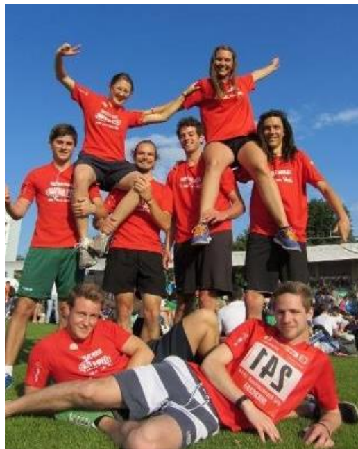
CCK-Staffeln beim Kleeblattlauf in Graz, Juni 2014