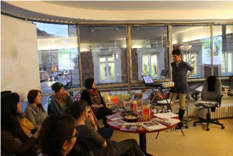
Filmabend und Diskussion zum Sumangali-Prinzip, Februar 2014