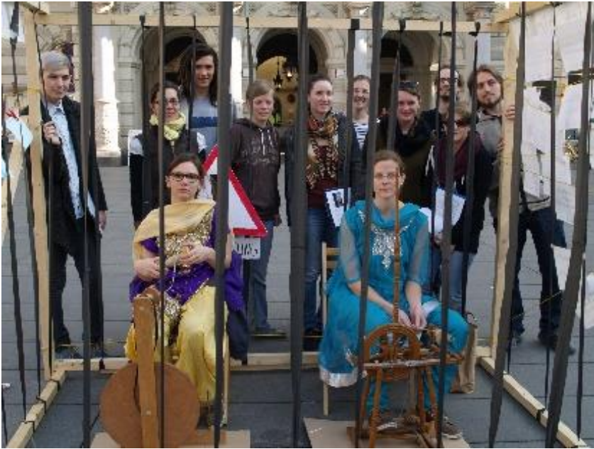
Straßenaktion gegen Lohnsklaverei („Sumangali“) am Hauptplatz Graz, März 2014