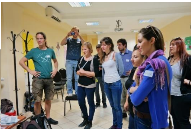
Vorstellung des Südwind Infotisches