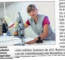
Arbeiter in einer Textilfabrik.

Hauptstädte und andere Arbeitsbedingungen in der Textilindustrie – bei welchen Modedesignern und Marken? Ein Bericht von Konrad Bading.