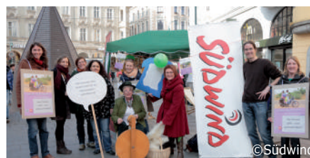
Südwind-AktivistInnen in Aktion

Auch heuer hat Südwind OÖ viele spannende Kooperationen mit unterschiedlichen Jugendorganisationen. Eine davon ist die jährliche Jugendsozialaktion „72 Stunden ohne Kompromiss“ der Katholischen Jugend.