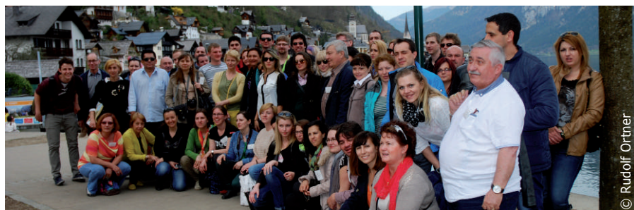
TeilnehmerInnen aus den sechs Projektländern bei der internationalen Konferenz 2013

Im Oktober 2014 startet ein neuer Durchgang des Lehrgangs zum Projekt „Menschenwürdige Arbeit für menschenwürdiges Leben“. Zusätzlich zu den sechs Modulen in St. Wolfgang ist eine internationale Konferenz in Bukarest geplant. Die Anmeldung läuft noch bis Ende Mai!