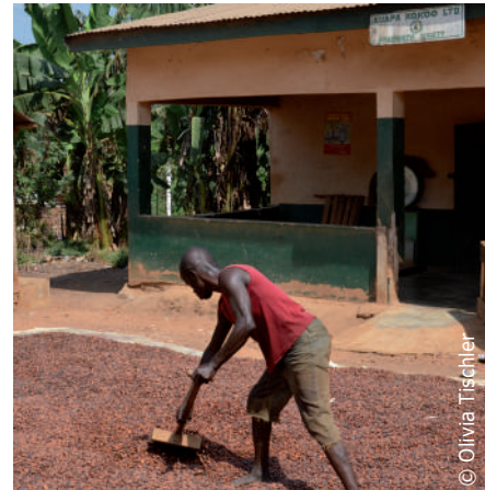
Trocknung der Kakaobohnen in Ghana

So auch bei Blue Skies, einem obstverarbeitenden Betrieb mit Fairtrade-Zertifizierung. Die Globalisierung und der billige Transport ermöglichen es, dass kleingeschnittene Mangostücke aus Ghana, abgepackt in Kunststoffboxen zu 200g, am nächsten Tag als frische Ware 5000 Kilometer entfernt in London angeboten werden. Dennoch zieht man als BesucherIn bei Blue Skies aufgrund der sehr hohen sozialen