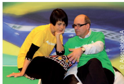
Der Autor bei der Frankfurter Buchmesse

Der brasilianische Autor Luiz Ruffato hat viel über sein Land zu sagen, das durch die WM bei uns im Blickpunkt steht. Bei seinem Besuch am 2. Juni auf der Leondinger „Urban Farm“ liest er aus seinem neuesten Roman „Feindliche Welt“.